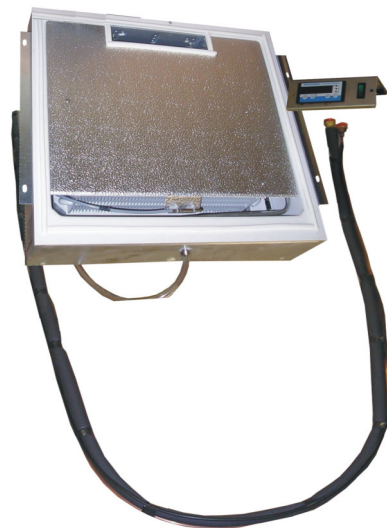
Abbildung ZS 5 split