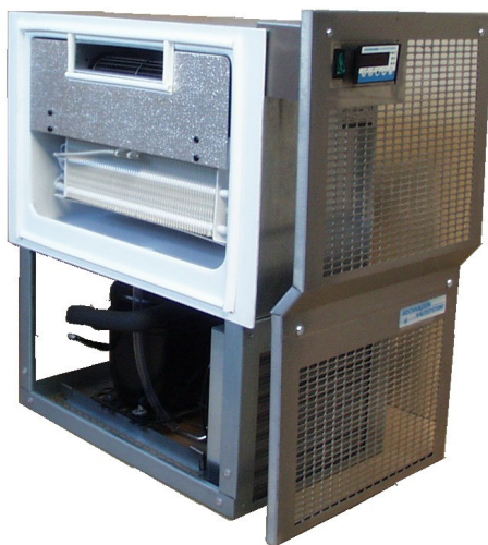
KSS 405 mit Be- und Entlüftungsblende